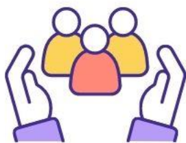
городское методическое объединение