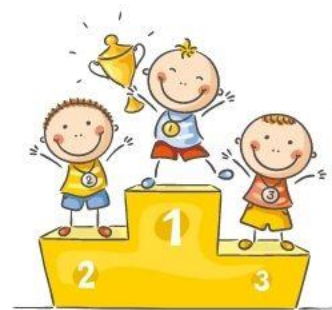
конкурсы различного уровня