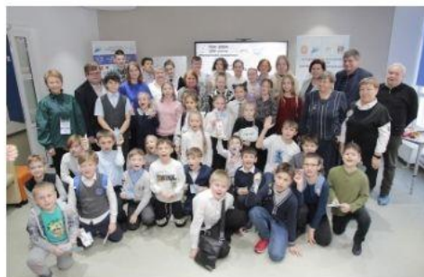
проведение воспитательных мероприятий