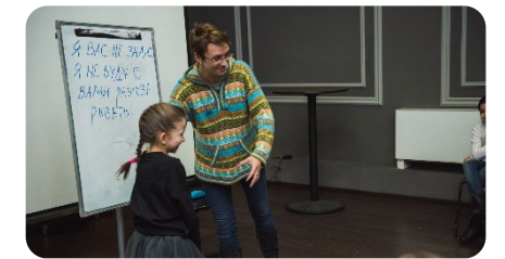
Школа безопасности «Стоп угроза»