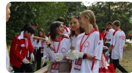
Патриотизм и историческая память