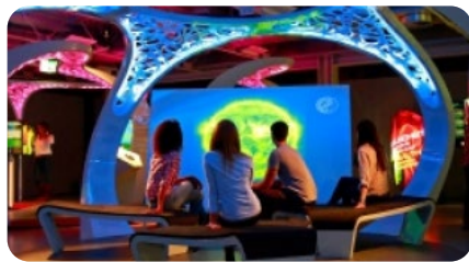
Наука и спорт