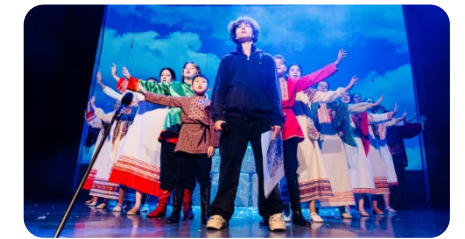
Культура и творчество