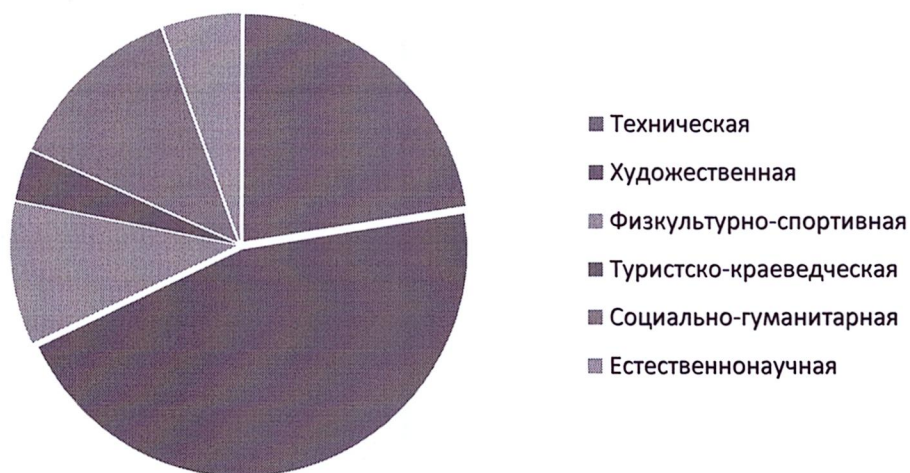
Рисунок 1. Классификация дополнительных общеобразовательных программ по направленностям дополнительного образования.

Реализация образовательной деятельности осуществляется в рамках шести направленностей, зафиксированных в лицензии учреждения. В 2022 году в МАУДО «ДПШ» утверждены к реализации 196 дополнительных общеобразовательных программ. Из них художественной направленности – 89, физкультурно-спортивной направленности – 20, социально-гуманитарной направленности – 25, естественнонаучной – 11, туристско-краеведческой – 7, технической направленности – 44 (рис. 1).